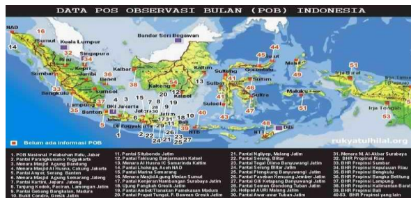
Gambar 1.1. Lokasi Pos Observasi Bulan Indonesia

Observatorium Tgk. Chiek Kuta Karang yang terletak pada 5 o 27' 59, 85" LU dan 95 o 14' 31,87" BT, dengan ketinggian tempat 8 mdpl, dan berjarak 15 m dari tepi pantai. 10 Pada dasarnya observatorium