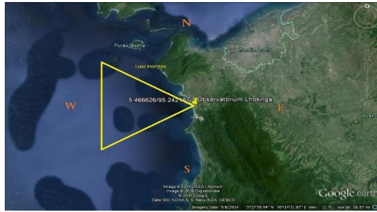
Gambar 1.2. Observatorium Tgk. Chiek Kuta Karang Aceh

Melihat dari sisi luasan pandangan terhadap ufuk, maka lokasi ini sangat bagus untuk dijadikan lokasi rukyat hilal baik itu pada saat deklinasi Matahari rendah atau bahkan pada saat Matahari berdeklinasi tinggi. Namun, adanya awan di sekitar ufuk menjadi kendala dalam melakukan rukyat di observatorium ini. Hal ini disebabkan karena ufuk observatorium Tgk. Chiek Kuta Karang merupakan ufuk yang berupa laut yang notabene merupakan sumber air terbesar. Observatorium Tgk. Chiek Kuta Karang memang memiliki rentang ufuk yang mencapai 65^{\circ} , sehingga hilal dengan ketinggian rendah pun dapat diamati di lokasi ini di sepanjang tahun, namun keberadaan awan di sekitar observatorium dan di sekitar horizon sangat akan mengganggu kegiatan rukyat.